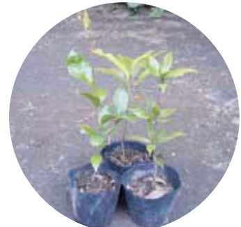
シイ・タブ・カシ